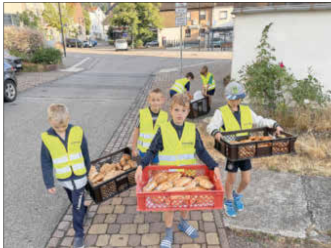
Die Kids, die als Erste wach waren, übernahmen den Brötchendienst

Dies liegt an der Klasse Teamleistung in den vergangenen Jahren hier in der JSG Freisen. Die künftigen Leiter stehen den Eltern und den Kindern jederzeit gerne Rede und Antwort, wenn's um den Jugendfußball in unserer Großgemeinde geht.