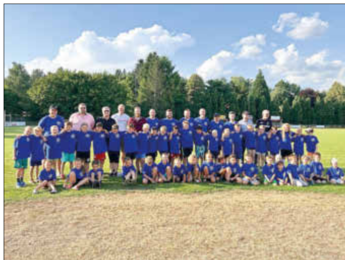
Kinder der G- und F-Jugend mit den Ehrengästen und dem Trainerteam

Am Samstag waren die ersten Jungs bereits um 5 Uhr wieder aktiv und liefen in der Frühe zum Bäcker ins Dorf. Nach dem Frühstück brach die Truppe ins Schwimmbad auf. Nach der Abkühlung im Schwimmbad gab es für alle Nudeln mit Hackfleischsoße von Arndt Sommer. Ein Dank auch an ihn für das leckere Mittagessen. Das angedachte Spiel „Eltern gegen Kinder“ fiel den Temperaturen zum Opfer. Abkühlung brachte dann die Bewässerungsanlage des Sportplatzes und der Fahrtwind beim Fahrradfahren um den Platz. Beim gemeinsamen Abendessen bekam jedes Kind ein neues JSG T-Shirt und einige Ehrengäste überreichten dem Orgateam Geldzuschüsse für die Aktion. Nach einer erneut kurzen Nacht wurde am Sonntag noch aufgeräumt. Vielen Dank an alle Helfer!